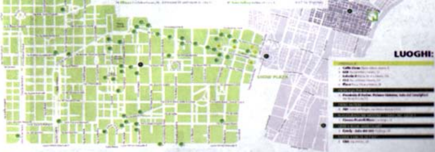
LA MAPPA DELLA MANIFESTAZIONE Il fulcro è rappresentato da piazza Vittorio e sono 45 i negozi del centro coinvolti nell'iniziativa (Green Point).

Un allestimento di grande impatto, ubicato in Piazza Vittorio Veneto, in grado di stimolare la curiosità e di attrarre il pubblico con una mostra a cura delle Scuole di Design Torinesi.